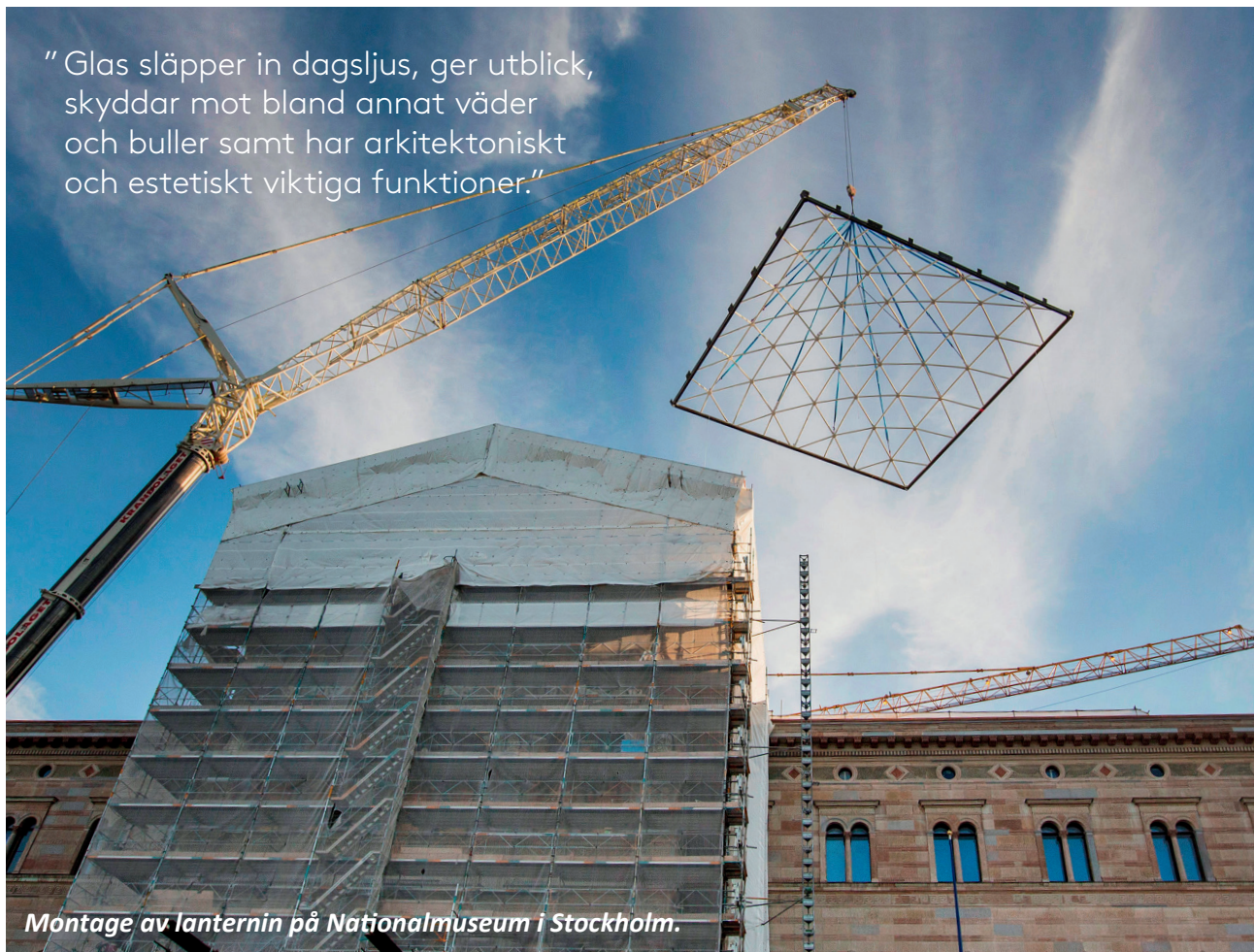
Montage av lanternin på Nationalmuseum i Stockholm.

”Glas släpper in dagsljus, ger utblick, skyddar mot bland annat väder och buller samt har arkitektoniskt och estetiskt viktiga funktioner.”